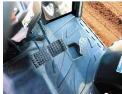
アクセルペダルとブレーキペダル