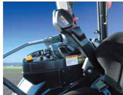
アームレスト(跳ね上げ時)