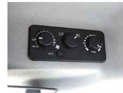
オートエアコン(CY型)