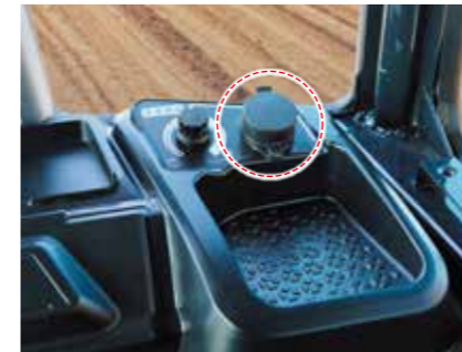
小物入れ&シガーソケット(CY型)