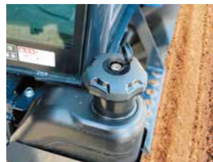
キー付き燃料キャップ