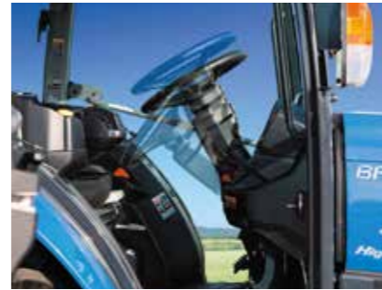
テレスコピック&チルトハンドル ※テレスコピックはZ型除く

グラマー社製シート *写真はCY型 長時間振動を受ける体に、優しく快適なシートです。 また、座面、背もたれの部分に水漏れや汚れに強い素材を採用しています。