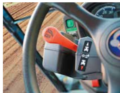
デクラッチ式パワーリニア