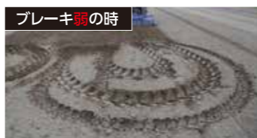
やわらかい土質でもほ場を傷めず、きれいな旋回が行えます。