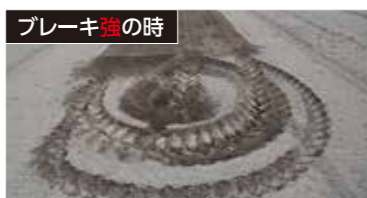
固く乾いたほ場ならブレーキを強くすると隣接耕うんがしやすくなります。