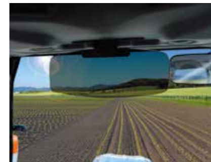
室内ルームミラーと半透明サンバイザー(CY型)