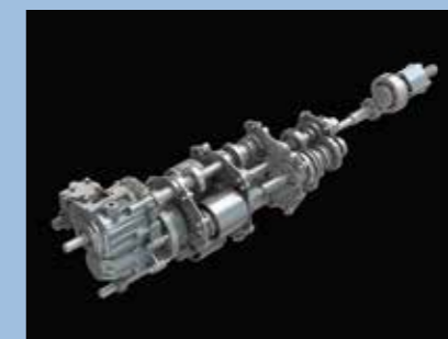
新たな トランスミッション IAVT

HSTと遊星ギアを組み合わせた先進の変速機。 HSTに比べ高い伝達効率が見られるので、 効率的な作業が可能。 操作も容易で、手元のレバーだけで停止から 発進・増減速が行え、クラッチ操作は不要。