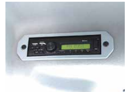
Bluetooth接続機能付きオーディオ(CY型) 好きな音楽をかけながら快適に作業ができます。