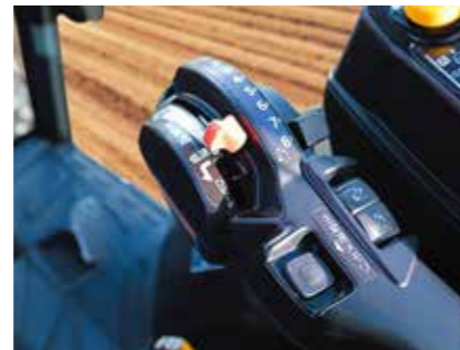
アームレスト 操作パネル