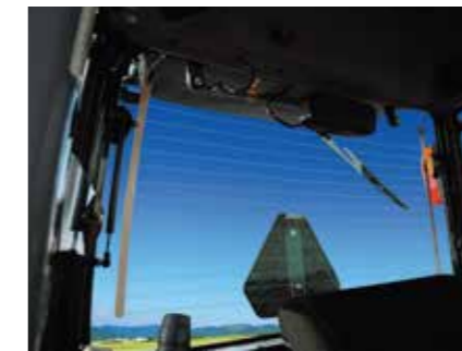
リアデフォグラー(CY型 OPT)