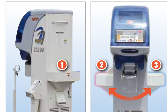
ホッパーは3カ所に設置できます。

本機の横からも玄米が投入できます。 臼すり機と横並びに置けるので、キレイに設置できます。