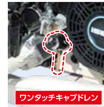
ワンタッチキャブドレン

ワンタッチで着脱できるボンネットと、開閉可能な補助苗枠で、エンジン等の点検・整備が大変便利です。また、キャブレターのドレンもワンタッチなので使用後の保管にも便利です。