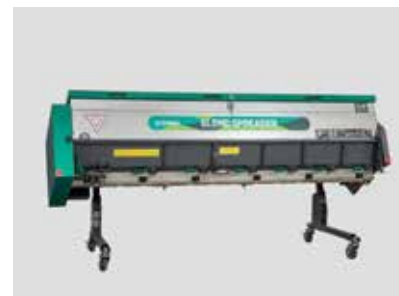
スタンド標準装備 キャスター付きで移動、収納が便利に行えます。