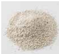
砂状肥料 ケイカル・ヨウリン・ 土壌改良剤