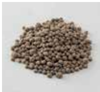
けいふん 粒径10mm以下