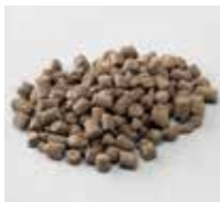
有機ペレット 長さ10mm以下