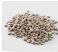
粒状肥料 粒状化成