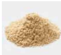
米ぬか [乾燥したもの]