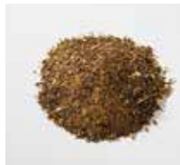
魚粉・骨粉 [乾燥したもの]