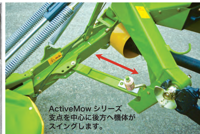
ActiveMow シリーズ 支点を中心に後方へ機体がスイングします。