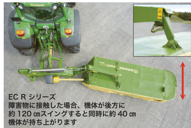
EC R シリーズ 障害物に接触した場合、機体が後方に約 120 cm スイングすると同時に約 40 cm 機体が持ち上がります

本機が障害物に接触すると、機体が後部にスイングして衝撃を和らげる保護機能が装備されています。これは障害物を回避すると、自動で元の位置に戻ります。