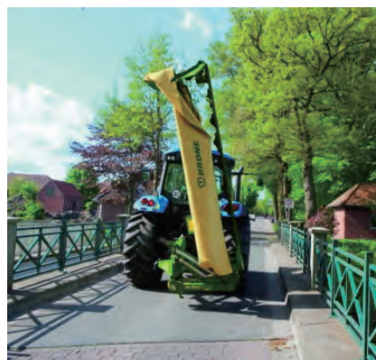
Active Mow シリーズ 縦100°折りたたみ