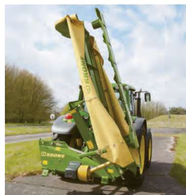
EC R 280 320 縦110°折りたたみ