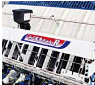
育苗箱施用剤散布機「らくまきちゃんR」